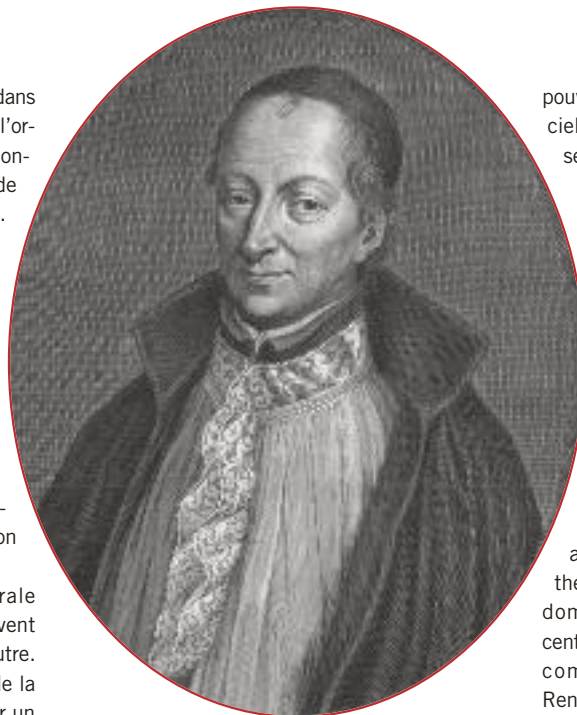
François de La Chaise, jésuite, confesseur de Louis XIV.

La politique officielle, quant à elle, s'appuie sur les Jésuites pour lutter contre le courant janséniste soupçonné d'être séditionnel : néan-