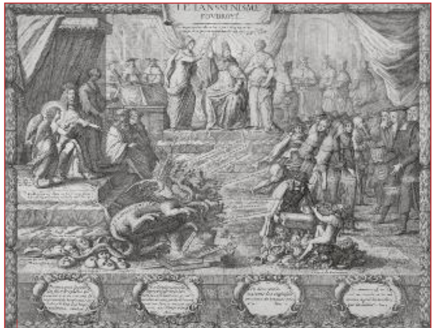
« Le jansénisme foudroyé », estampe conservée au musée de Port-Royal des Champs.

À l'inverse, il existe des affinités entre le stoïcisme et certains aspects du jansénisme : la dénonciation de la folie humaine ; l'esprit de sérieux ; le goût de l'activité intellectuelle et scientifique ; une vision du monde volontiers empreinte de tragique. Mais christianisme et stoïcisme divergent sur l'essentiel : la question du péché originel et de la nature corrompue est étrangère à la pensée des Grecs. Les chrétiens,