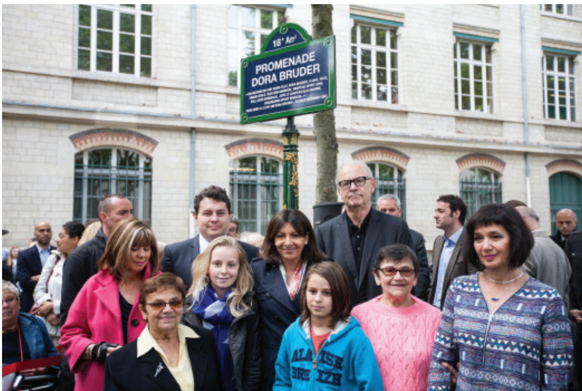
▲ Anne Hidalgo et Patrick Modiano inaugurent la promenade Dora-Bruder, Paris, XVIII e arrondissement.

À chaque page du roman figure au moins un nom de rue, assorti d'un numéro d'immeuble, parfois de plusieurs. Ces précisions topographiques se répètent constamment, au point de faire partie de l'écriture romanesque qu'elles semblent parasiter, voire même alourdir. L'écriture de la liste, qu'on a déjà pu analyser pour